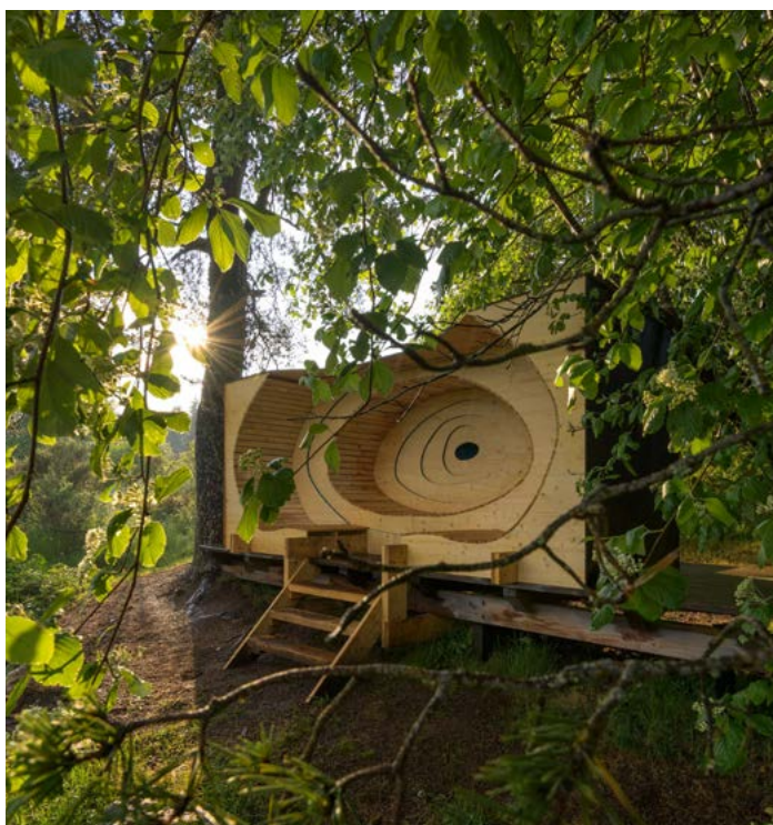
Simulation de l'œuvre

Graphiste, designer, ébéniste vivant dans les Alpes, je puise mon inspiration dans cet environnement montagnard naturel et sauvage. J'aime penser et fabriquer des objets qui apporteront un bout de nature dans notre quotidien. L'hybridation entre fabrication traditionnelle et numérique est souvent présente dans mon travail. J'ai développé mon activité artisanale indépendante après divers expériences en fab-labs, ateliers partagés bois, agences de design.