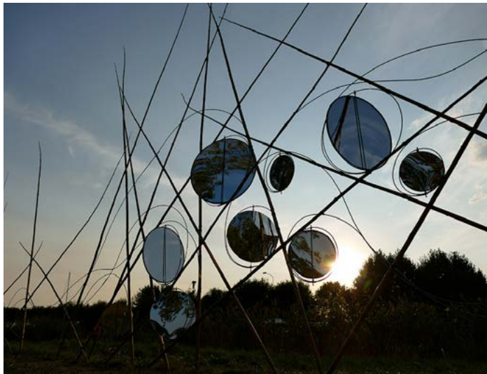
Simulation de l'œuvre