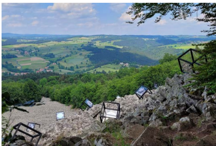
Simulation de l'œuvre